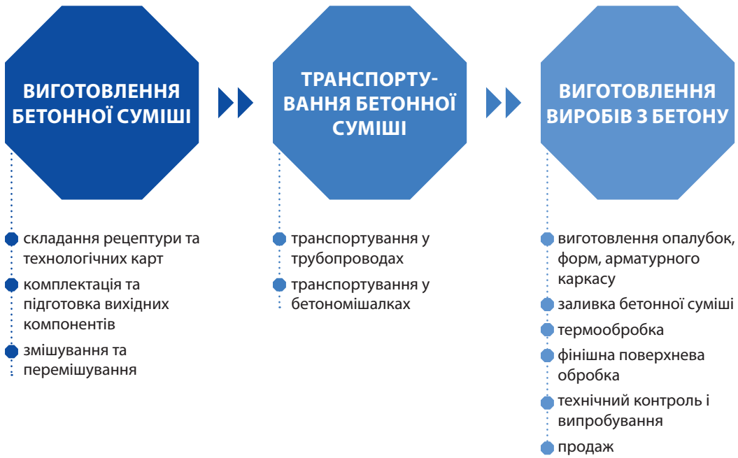
СХЕМА №1. БІЗНЕС-ПРОЦЕСИ НА РИНКУ